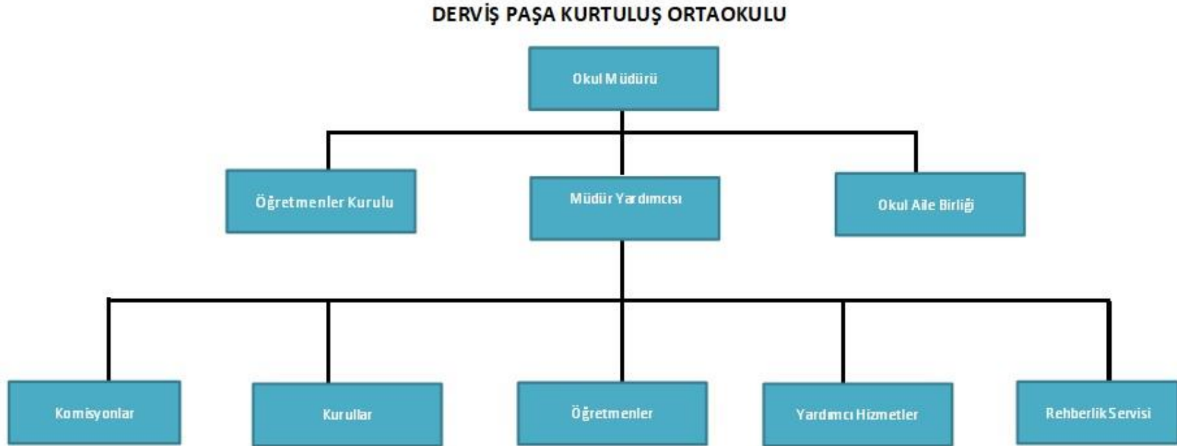
Şekil 1: Organizasyon Şeması